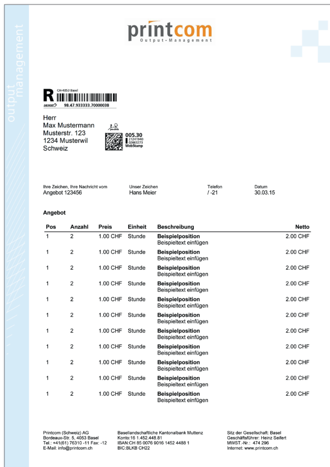
Beispiel eines als Einschreiben frankiertes Dokumentes